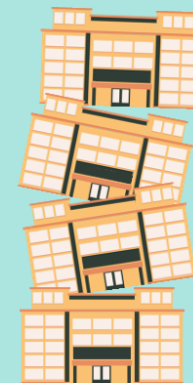
3907 panden Na 1992