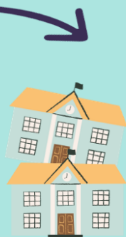
1619 panden Tot 1946