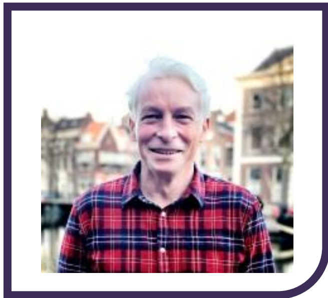
Daniël van Noordennen Ruimte-OK