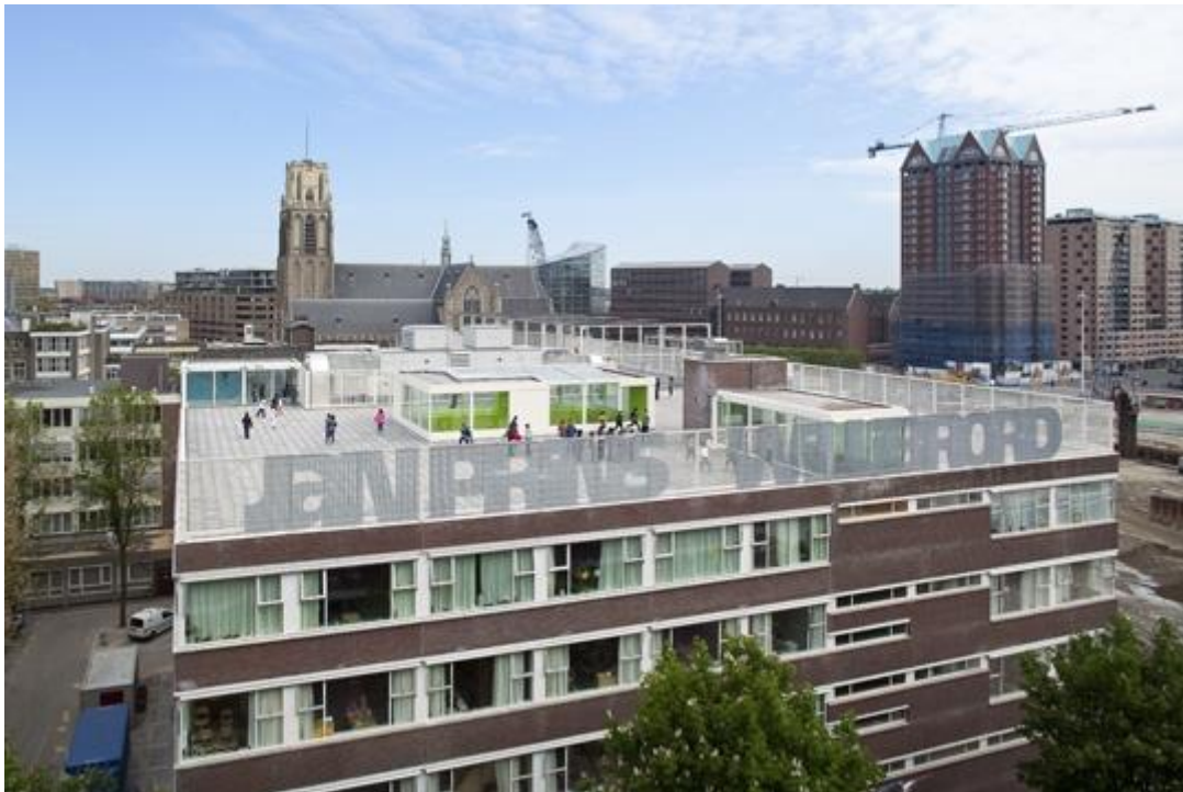
Brede School Nieuwstraat, Rotterdam, ontwerp Arconiko architecten.

De Scholenbouwatlas speelt in op de grote behoefte aan informatie over verbouwen. Het brengt de actuele verbouwingsopgave van gebouwen voor basisonderwijs en kindcentra in beeld en laat zien welke mogelijkheden bestaande, verouderde onderwijsgebouwen bieden voor het geven van eigentijds onderwijs. Naast inspirerende voorbeelden uit de praktijk bevat het boek ook essays waarin de urgentie, achtergronden en de belangrijkste actoren van de verbouwoopgave worden benoemd.